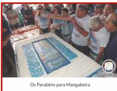
Os Parabéns para Mangabeira