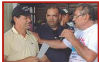
Jado da SEDURB, recebendo homenagem