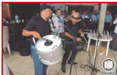
Trio de Forró SWING NORDESTINO