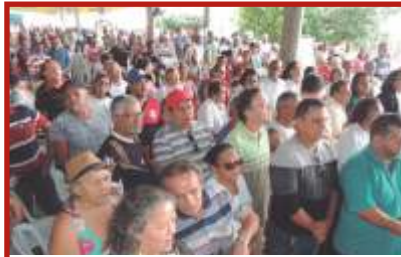
População prestigiou as Comemorações alusivas aos 35 Anos de Mangabeira