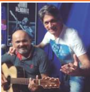
O Cantor e Compositor LUPE ARAÚJO, lançando novo CD