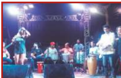
Banda Encantus fazendo encerramento do aniversário de Mangabeira e 2 anos da Mangabeira FM