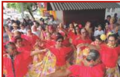
Grupo ARCO IRIS, homenageando Mangabeira