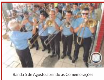
Banda 5 de Agosto abrindo as Comemorações