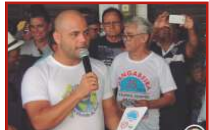
Thiago da Escola de Enfermagem São Vicente de Paula