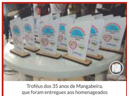
Troféus dos 35 anos de Mangabeira, que foram entregues aos homenageados