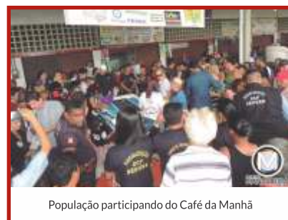
População participando do Café da Manhã